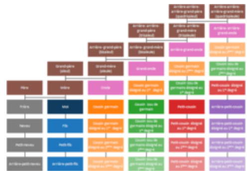
Illustration des degrés de parenté.