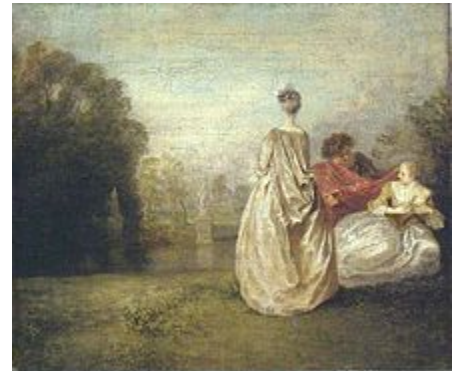
Les Deux Cousines par Antoine Watteau.

Un cousin est l'enfant de l'oncle ou de la tante d'une personne, quelle que soit la génération. Tous les descendants d'une fratrie sont cousins entre eux. Dans le langage courant, le terme « cousin » désigne souvent un cousin germain , c'est-à-dire le descendant immédiat d'une fratrie. Dans un sens plus général, on appelle parfois « cousin » tout individu avec lequel on possède au moins un ancêtre commun.